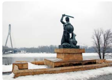
Syrena jest herbem Warszawy, a jednocześnie symbolem związku naszego miasta z rzeką