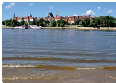
Wisła przepływająca przez Warszawę jest ważnym składnikiem układu i krajobrazu miasta