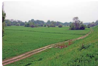
Pola uprawne na nadrzecznych obszarach wcześniej porośniętych łęgami dają obfite plony dzięki urodzajności gleby. Zawdzięczamy to rzece, pozostawiającej na tarasach zalewowych żyzne namuly

O bogactwie i unikatowości przyrodniczego oblicza Wisły w Warszawie stanowi także system piaszczystych łąwic i kęp [kępy to wyspy porośnięte wiklinami i wierzbami]. Są one nie tylko ważne – dzięki zróżnicowaniu gatunków roślin – i piękne poprzez subtelną kolorystykę w różnych porach roku; przede wszystkim stanowią miejsce życia i od-