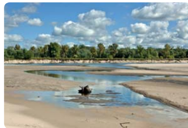
System łąwic i kęp na Wiśle w Warszawie można porównać do naszyjnika z pereł