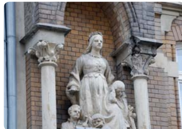
Fronton pięknej kamienicy przy ul. Foksal 19, należącej niegdyś do WTW, zdobi urodziwa alegoria Wisły